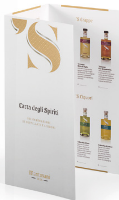
Carta degli Spiriti

Il Menu con la selezione dei prodotti Mantovani